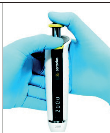
Figur 2